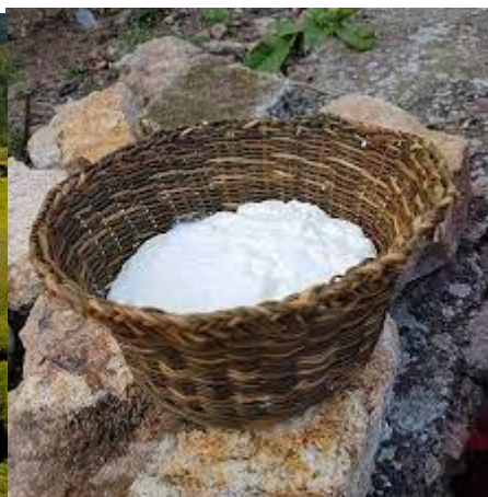
Fattoghje et son brocciu

La rumeur devient un fait acquis, il y a eu pêché, l'abbé est un pervers. Hibernatus eut beau jurer devant la croix pendant la messe qu'il n'y était pour rien, qu'il était innocent et que cette rumeur n'était que malveillance, rien n'y fit. Les veuves en noir à la sortie de l'office n'en chuchotèrent que de plus bel.